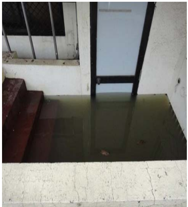
恐造成漏電危險、室內財產浸泡損壞、積水難退需大批人力清掃處理