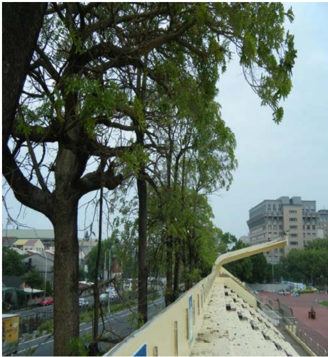
凸出司令台之黑板樹需常年修剪，斷枝容易砸中路邊停放車輛