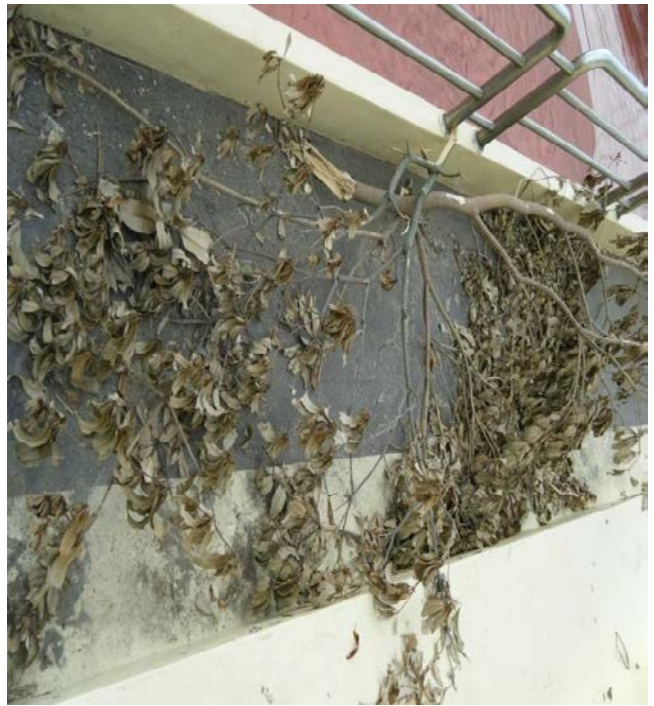
易斷的枯枝及落葉造成排水孔堵塞