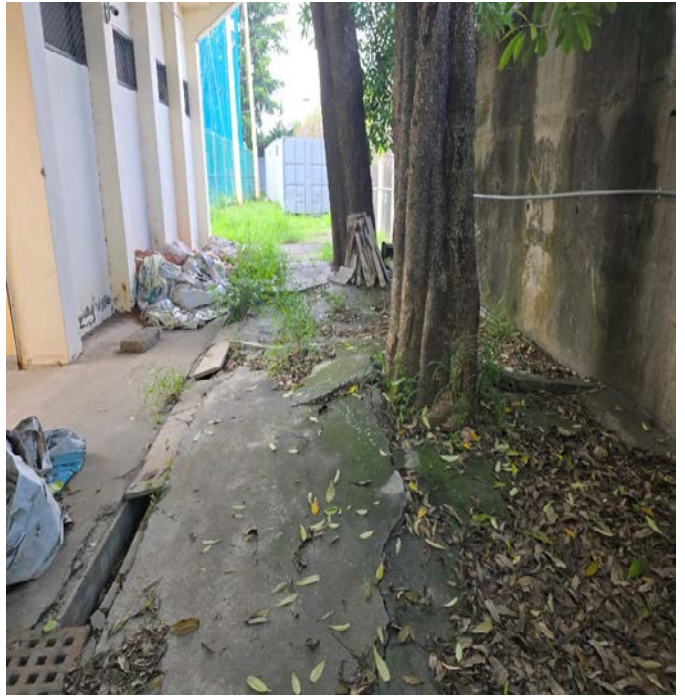
造成地板隆起、影響行走安全