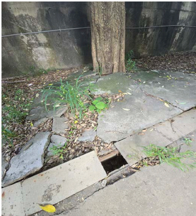
破壞排水溝及化糞池功能