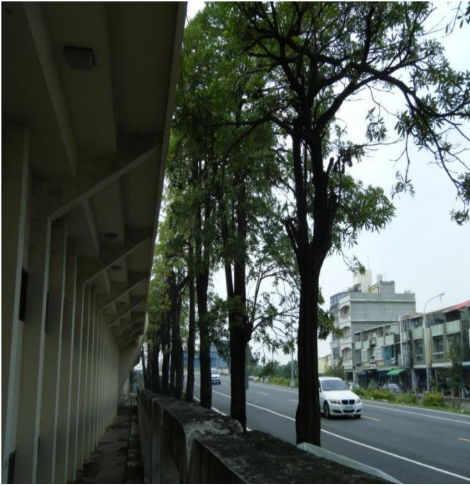
司令台後方黑板樹 7 株